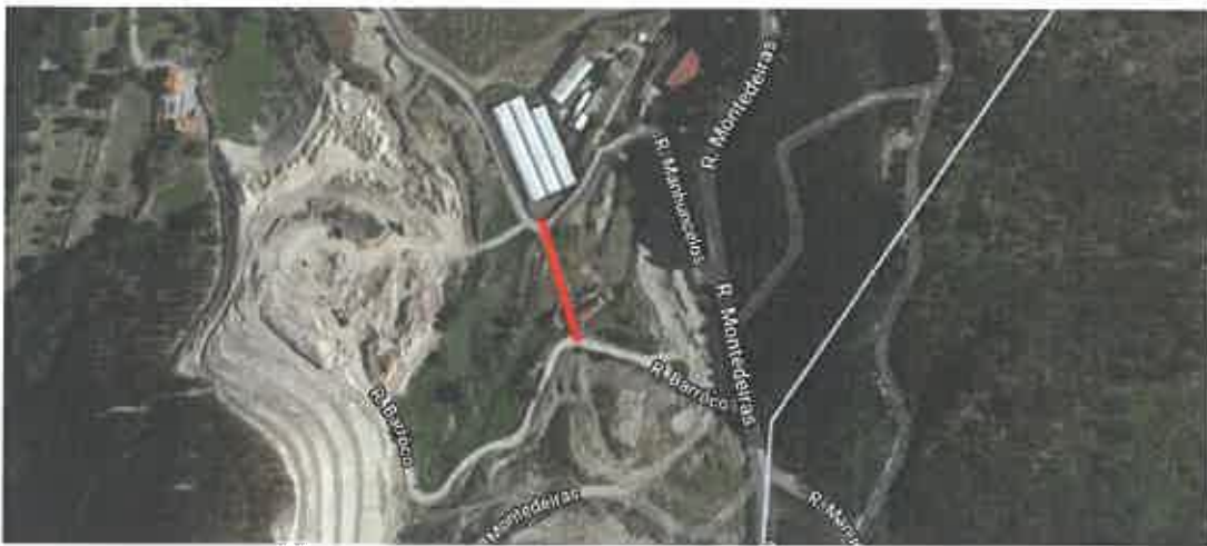
Figura 3 – Travessa do Pinheiral

Paredes de Viadores e Manhuncelos, 2 de abril de 2022