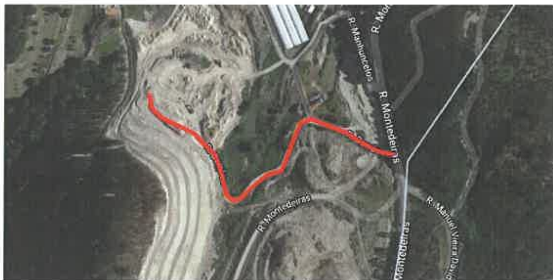
Figura 2 – Rua do Pinheiral